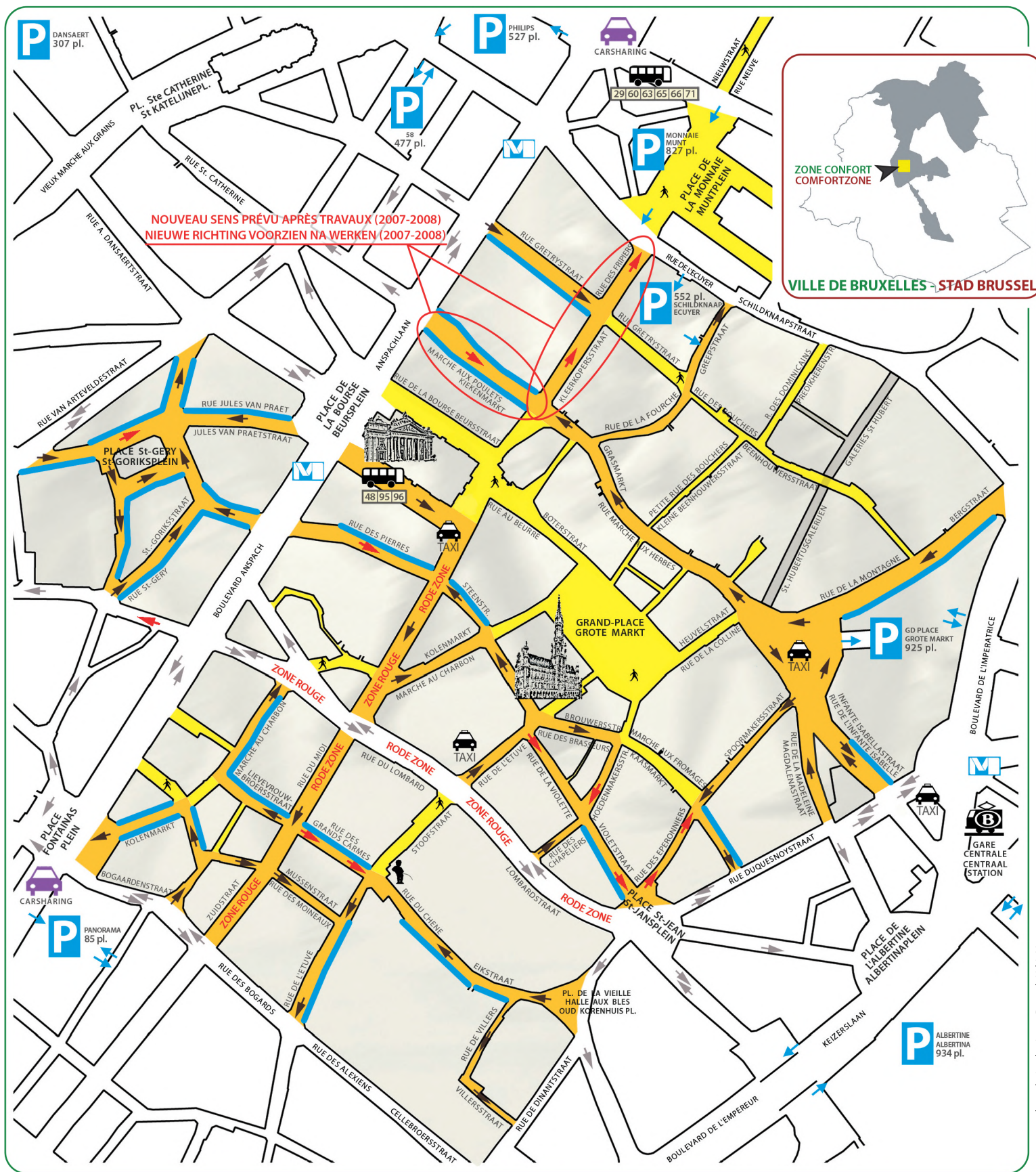
carto: sur base de / op basis van Brussels Urbis V 1.04