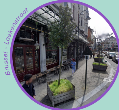
Brussel - Laekenstraat

Er is nog geen studieproject ingediend bij de Stad en de ideeën die tijdens de bijeenkomsten zijn uitgewisseld, bevinden zich nog in de brainstormfase, waarbij beplanting mogelijk is zonder parkeerplaatsen te verwijderen.