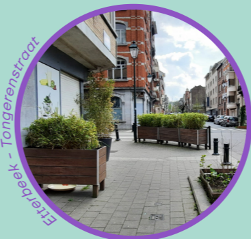
Etterbeek - Tongerenstraat