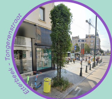
Etterbeek - Tongerenstraat